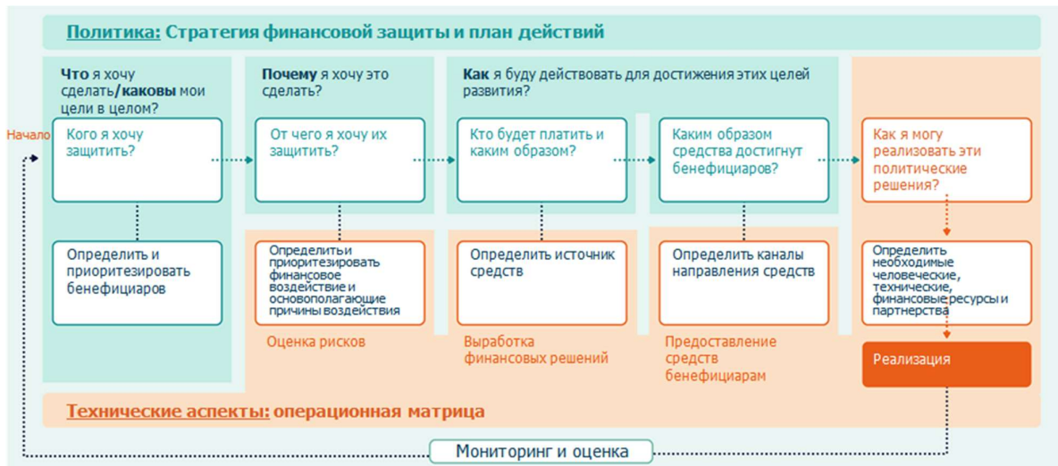
Рисунок 2. Определение приоритетов политики в области финансирования риска бедствий.