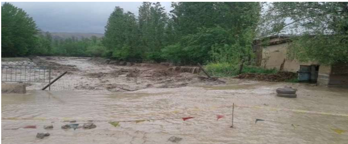
Наводнения в Кыргызской Республике.

В Кыргызской Республике меры по реагированию на бедствия финансируются сначала за счет бюджета Министерства чрезвычайных ситуаций и бюджетов органов местного самоуправления. После израсходования этих средств Министерство чрезвычайных ситуаций через Министерство финансов может обратиться к правительству с просьбой об оказании дополнительной поддержки. Дефицит финансирования, вероятно, сначала покрывается за счет средств Специального счета по предупреждению и ликвидации последствий чрезвычайных ситуаций или Государственного бюджетного резерва, затем (при необходимости) за счет перераспределения средств между статьями бюджета или за счет средств из иных источников.