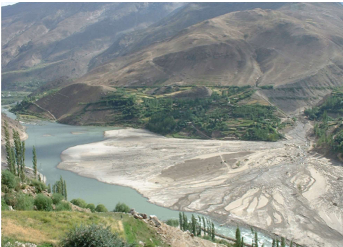
Сель в Барсеме в 2015 году.

В 1999—2016 годах среднегодовой ущерб, нанесенный бедствиями в Таджикистане (за исключением убытков), составлял около 75 миллионов долларов США.