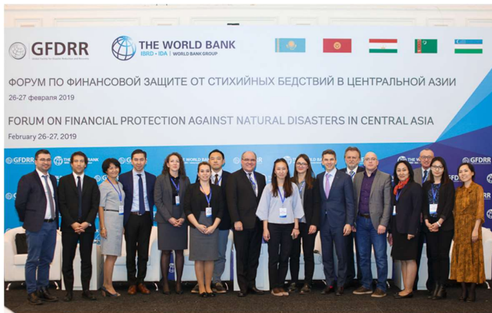
Организаторы форума.