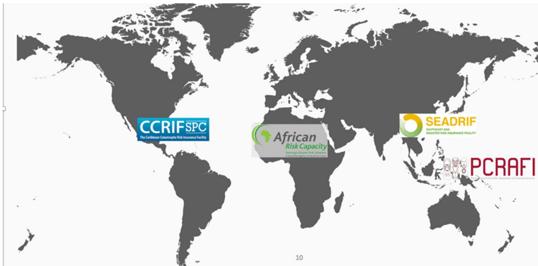
Рисунок 4. Существующие суверенные пулы рисков.

Суверенные пулы рисков появляются как экономически эффективный инструмент, благодаря которому страны получают доступ к быстрому финансированию для целей реагирования на бедствия. Такие пулы несут в себе ряд выгод для стран: они (i) обеспечивают передачу риска частному сектору; (ii) смягчают расходы правительства; (iii) обеспечивают немедленную ликвидность после бедствий; (iv) предусматривают использование параметрических триггеров, которые дополняют собой другие триггеры для финансирования непредвиденных расходов; (v) поддаются адаптации к индивидуальным потребностям стран в страховом покрытии; (vi) предоставляют техническую помощь и информацию о риске; и (vii) предусматривают гибкие страховые выплаты или страховые выплаты, привязанные к существующим программам.