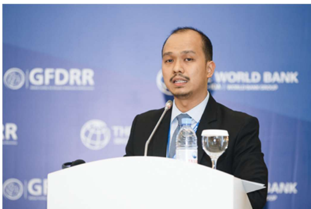
Эрвин Д. Ста. Ана, заместитель государственного казначея, Бюро казначейства, Филиппины.

Филиппины расположены вдоль Тихоокеанского огненного кольца и в крайне высокой степени подвержены ряду природных опасностей, в том числе тайфунам (в стране происходит в среднем 20 тайфунов в год), землетрясениям и извержениям вулканов.