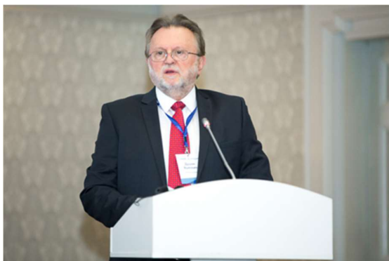
Душан Вуйович, кандидат наук, профессор экономики Факультета экономики, финансов и администрирования, бывший министр финансов Сербии.

В результате произошедших в мае 2014 г. наводнений, которые стали следствием чрезмерных осадков, пострадали 22% населения Сербии, 32000 человек были вынуждены покинуть свои дома и 57 человек погибли. Ущерб и убытки, нанесенные наводнениями —предприятиям, фермерским хозяйствам, школам, медицинским учреждениям, домам и критически важной инфраструктуре, — составили, по оценкам 1,7 миллиарда евро, или 4,8% ВВП Сербии. Помощь правительству после наводнений оказали доноры, но даже объединенных усилий доноров и правительства оказалось недостаточно. Недостаточность ресурсов привела к задержке в осуществлении мер реагирования и реконструкции, что, в свою очередь, усугубило последствия бедствия.