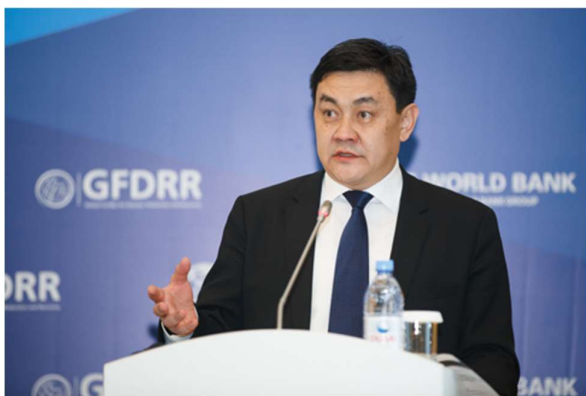
Санжар Муқанбетов, председатель Государственной службы регулирования и надзора за финансовым рынком, Кыргызская Республика.

В 2015 году правительство Кыргызской Республики внедрило программу обязательного страхования частной собственности от бедствий. До этого правительство выплачивало компенсации пострадавшему от стихийных бедствий населению и аккумулировало значительные обязательства. В 2007—2014 годах в виде ссуд было предоставлено около 72 миллионов долларов США, при этом из года в год неуклонно увеличивалось количество непогашенных займов. Кроме того, несмотря на возрастающую поддержку со стороны правительства, ее все равно было недостаточно для обеспечения быстрого и полного восстановления после стихийных бедствий. После серии небольших землетрясений и крупного землетрясения в Иссык-Кульской области, президент Кыргызской Республики поручил правительству проработать вопрос страхования жилья от стихийных бедствий.