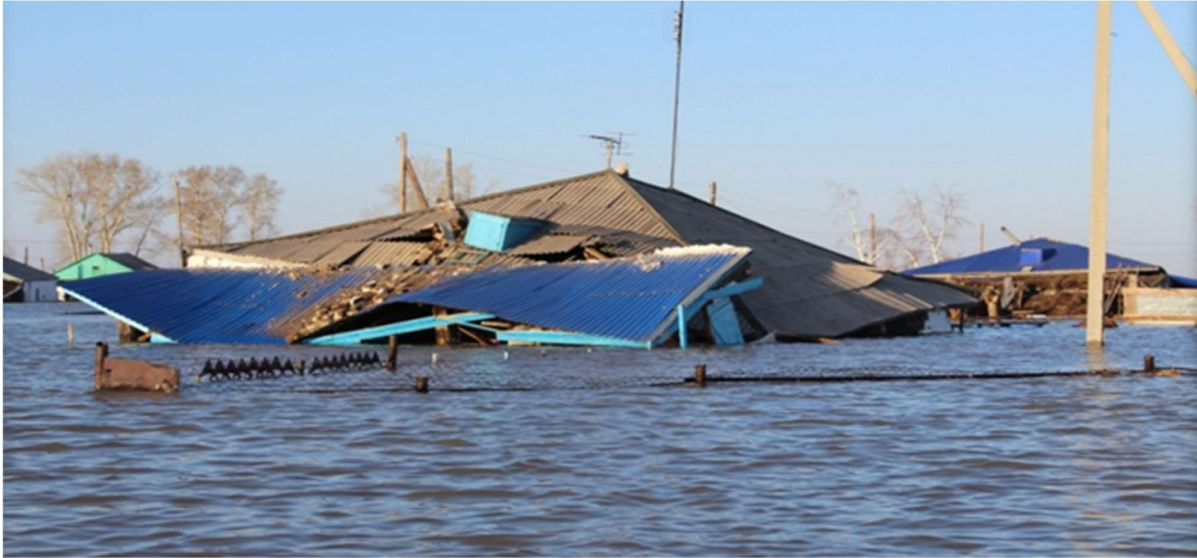
Наводнения в Казахстане.

В зависимости от серьезности бедствия финансирование мер по ликвидации последствий бедствий — в том числе реконструкции государственной инфраструктуры и объектов — в Казахстане обеспечивается за счет бюджета организаций, местных исполнительных органов или национального правительства.