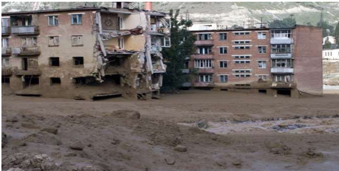
Бедствия в Узбекистане.

В Узбекистане первоначальную ответственность за финансовое обеспечение мер по реагированию на бедствия и восстановлению возлагается на органы государственной власти на местах, ведомства, организации и отраслевые министерства, т.е. на соответствующие заинтересованные стороны, которые входят в Государственную систему предупреждения и действий в чрезвычайных ситуациях (ГСЧС), возглавляемую Министерством по чрезвычайным ситуациям. В случае израсходования этих средств финансирование мер по ликвидации последствий бедствий может обеспечиваться за счет резервного фонда Кабинета Министров, материальных резервов Общества Красного Креста, донорской или двусторонней помощи. Также Постановлением Кабинета Министров № 242 предусматривается соответствующее страхование частной собственности от бедствий.