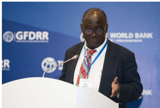
Ато Браун, Постоянный представитель в Республике Казахстан, Всемирный банк.

Форум открыл Постоянный представитель Всемирного банка в Республике Казахстан Ато Браун. «Сегодня мы находимся в таких условиях, когда стихийные бедствия — не отдаленная угроза, а реальность, — обратился он к аудитории. — Из-за своих географических особенностей и неоднородного ландшафта Центральная Азия в крайне высокой степени подвержена различным природным опасностям». Он напомнил участникам, что город Алматы, в котором проходил форум, в 1911 году был разрушен в результате землетрясения и что регион в целом подвержен высокому сейсмическому риску: по оценкам, убытки от землетрясений составляют в среднем 3,2% регионального ВВП в год.