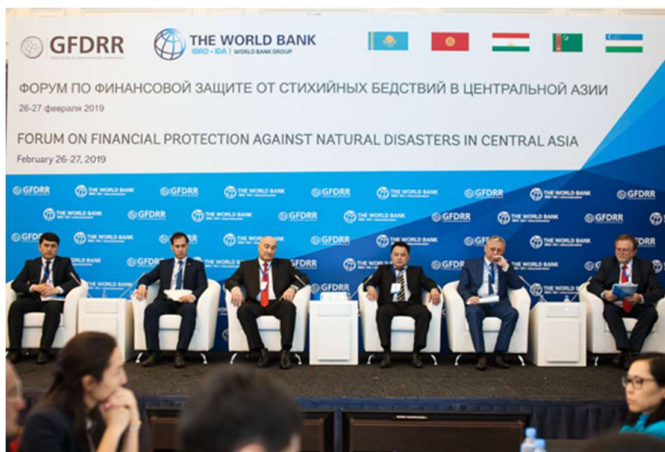
Представители пяти стран Центральной Азии.

В Кыргызской Республике в 2018 году в результате 99 бедствий был нанесен ущерб, по оценкам, в размере 17,8 миллиона долларов США, погибли 18 человек. Например, от сошедшего в Баткенской области селевого потока серьезно пострадала частная собственность и государственная инфраструктура. В 2017 году в результате 339 бедствий был нанесен ущерб, по оценкам, в размере 14,9 миллиона долларов США, погиб 141 человек.