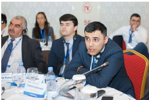
Вопросы о резервных фондах со стороны аудитории.

Еще одной страной, где имеется резервный фонд, является Мозамбик. Правительство этой страны часто сталкивалось с расходами из-за крупных бедствий, появляющимися тогда, когда уже были израсходованы предусмотренные на год средства общих резервных фондов. В 2017 году правительство приняло решение о создании резервного фонда для финансирования мер