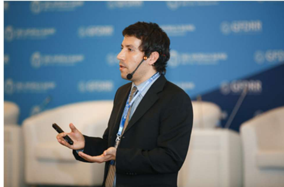
Луис Алтон, специалист по финансовому сектору, Программа по финансированию риска бедствий и страхованию от риска бедствий, Всемирный банк.

Есть некоторые первоначальные шаги , которые страны могут предпринять для укрепления финансовой устойчивости к бедствиям :