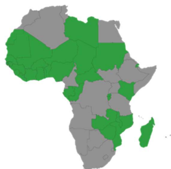
Рисунок 5. Государства-члены Фонда ARC.

обеспечения средств для покрытия непредвиденных расходов, который позволил бы защитить жизнедеятельность населения региона и достигнутые успехи в области развития. Это первый суверенный страховой пул в африканском регионе и первый пул в мире, в котором страховые выплаты привязаны к планам непредвиденных расходов. Управление Фондом ARC осуществляют участники (33 страны-участницы, см. Рисунок 5), а регулируемая частная страховая компания членов также осуществляет пулинг рисков государств-Фонда ARC, страхование и иные функции, а передает риск рынкам. Благодаря Фонду страны-участницы оперативно получают после стихийного бедствия.